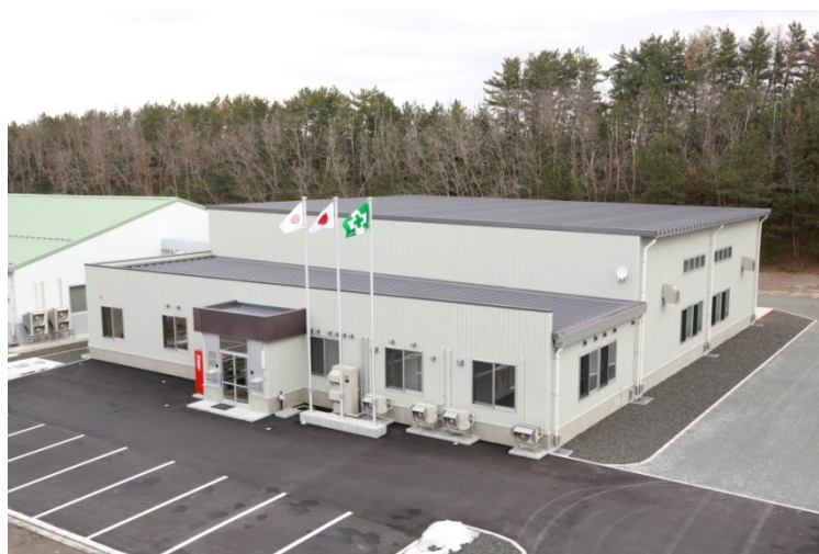
「能代サービスセンタ」「能代トレーニングセンタ」の外観