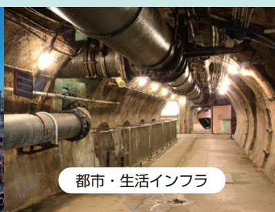
都市・生活インフラ