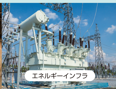
エネルギーインフラ