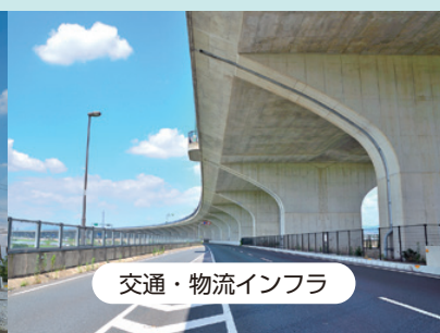
交通・物流インフラ